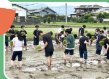
稲の苗を植えている様子