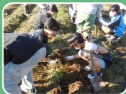
ジャガイモを収穫している様子